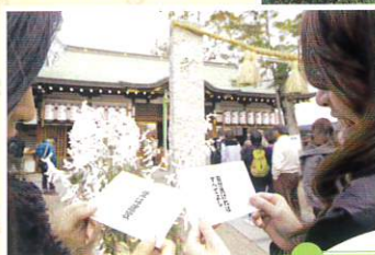
布忍神社の恋みくじ