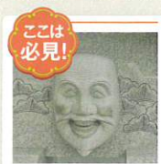
ここは必見！ 日本で唯一の歯歯面（は）で歯に触れると丈夫になるといわれる「歯神」様

参集殿前には「天満宮 享和元年(1801)九月」と刻した手水鉢が置かれているが、これは全国で5番目に大きな前方後円墳の河内大塚山古墳（西大塚）の石室材と考えられる。