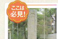
ここは必見！ 「行基菩薩安住之地」石碑

手水舎の東側には「行基菩薩安住之地」の石碑が建っている。江戸時代には、同地に奈良時代の高僧である行基が居住していたという伝承があった。神社北西の大和川に架かる橋を行基大橋と呼ぶのはこのためである。