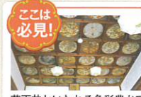
ここは必見！ 花天井といわれる色彩豊かで見事な「花卉図（かぎず）」