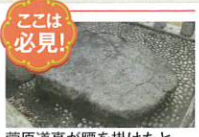
ここは必見！ 菅原道真が腰を掛けたといわれる「神形石」