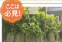
ここは必見！ 昔、若者が力くらべをしていた「力石」

現西鳥居が旧来の参道であったが、この鳥居側に6個の力石が置かれている。東我堂村・西我堂村の若者が力試しに使った楕円形の自然石である。いずれにも文字が刻まれ、「明治石 東連中□□□」「金剛石 東連中」「八幡石 西連中」「龍王石 西連中」「力石 東連中」「力石 西連中」とあり、明治時代初期のものと思われる。